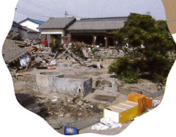
津波で被害を受けた住宅