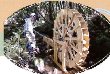
水車、夏には川遊びができます。