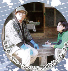
避難所のニーズの聞き取りを行っています。

一方、WEの拠点のある静岡県富士宮市では、別働隊が街中で精力的に募金活動を行い、5月1日現在、集った金額は150万円を超え、募金箱を置かせていただいている店舗も23店舗となりました。金銭的支援以外にも物的支援や、ボランティアとしてWEのスタッフと一緒に現地に足を運んでくださった方も何人もいらっしゃいます。こうした活動を通じて強く感じたのは、今回の震災で多くの人が心を痛め、自分でも何かできることを探しているということです。被災地以外で何かしらの支援を行いたい人の「おもい」を現地のニーズと繋ぐこと、それも私達の大きな役割であると感じています。現在、いわきの町の多くは震災前の状態を取り戻したように見えます。ただ、子どもは外遊び自粛が続き、県外に疎開した人の多くはまだ帰って来ていません。被災者が自立して生活することが復興の目標だとすれば、本当の意味での復興にはまだかなり時間がかかるでしょう。WEは今後もいわきに焦点を絞り、地域の人や団体と有機的に繋がりがつつ、「子ども・環境教育」「体験交流・観光」「ネットワーキング」といった本業により近い分野で息の長い活動を行っていく予定です。