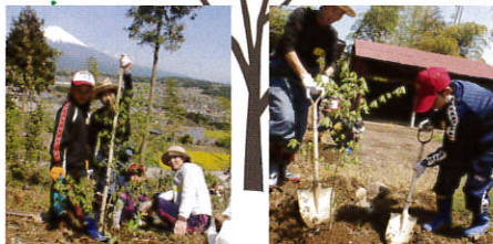
竹林整備後の土地へ植樹をしました。

活動場所となったのは、柚野エリアで竹林整備を行なう際にお世話になった興徳寺で、昨年度中に竹林整備作業もひと段落したため、次の段階へと移行しました。次は"植樹"で、近隣にお住まいの方から植樹のポイントなどを聞きながら、すっきり晴れた青空の下、参加者6名で気持ちよく作業できました。竹林整備後の土地への植樹、苗を掘り起こすところから始めた点など通