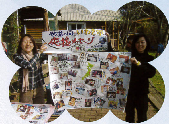
世界の国から届けられた いわきへの応援メッセージ

富士山、福島、広島の3地区で、森・人・地域を育てる10年間のプロジェクト vol. 21