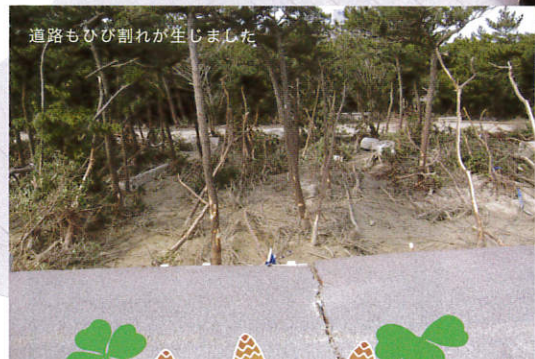
道路もひび割れが生まれました

いわきの森に親しむ会としてはガソリン不足が原因で3月に10日間程活動を休止しましたが、4月からは通常の活動に戻りました。現在のところ、湯ノ岳山荘に近い地元の方々の参加が中心になっていますが、少しずつ範囲を広げていきたいと思っています。