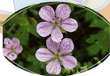
ビッチョウフウロ (フウロソウ科)

山地の湿った林縁に群生するゲンノショウコなどの仲間。中国山地で独自に分化した貴重な植物。