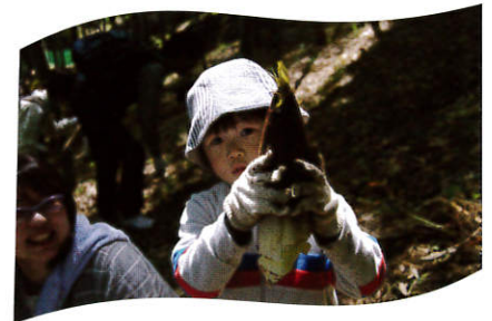
思う存分タケノコを掘る事が出来ました!