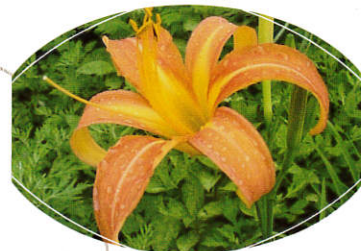
ノカンゾウ・ヤバカンゾウ (ユリ科)

独特な臭気を持つ植物。十葉(重葉)と呼ばれる、多種多様な作用を持つ薬用植物。湿気のある場所に群生している。若芽は山菜、全草を乾燥してお茶に。