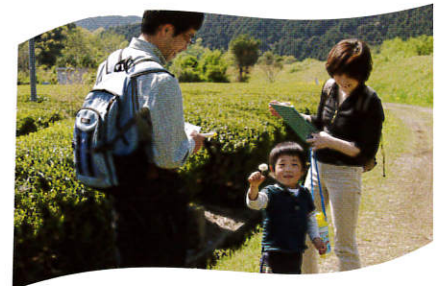
竹林に生えるタケノコ掘りに親子で参加!

竹林を畑としている地域の方を講師に、タケノコ掘りを行いました。全国的に今年はタケノコ不足と言われ、4月の終わりにも関わらずあまりタケノコが出てきていないと聞いていました。前日に恵みの雨ががあったことで、当日は参加者12名全員が思う存分タケノコを掘ることができました。タケノコは食べても、竹林に生えているタケノコを見るのが初めての親子など、本物と出会えたことを楽しんでいました。おいしいタケノコを育てるためには肥料を蒔いたり、間引きをしたりとしっかりとした管理が必要など、新しい学びもあったようで、本物と出会う体験が十分にできました。