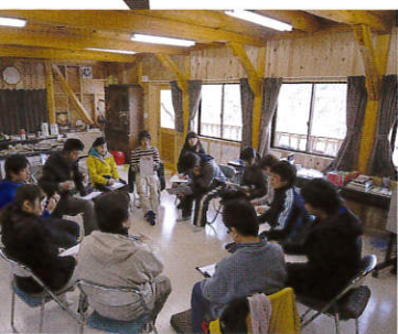
活動報告ユースキャンプ

3月27日(日)~29日(火)の2泊3日 プレイリーダー養成コースキャンプを 開催しました。このキャンプは、主として 中学生を対象に、ろうきん森の学校で開 かれる行事のボランティアスタッフを