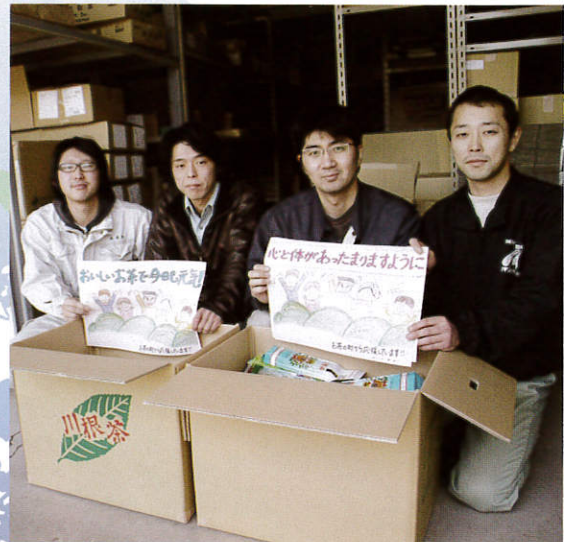
川根茶も贈って喜ばれました。

今回の震災で私たちは、日常ごく当たり前に使っている電気・ガス・水道などのインフラの脆さ、石油や原子力に依存したエネルギー政策の危うさを実感させられたのではないのでしょうか。今回の震災を教訓に、すべての人が今までの自分のライフスタイルを一度見直し、より自然に逆らわないライフスタイルを模索し、実行する時が来ている気がします。その際、日本で脈々と受け継がれてきた自然と調和する暮らし、里山の知恵は大きなヒントとなります。開始当時から「日本の里山再生」を掲げ、森を育む、人を育む、森に親しむ活動を3地区で展開してきた「ろうきん森の学校」が果たすべき役割は今後益々大きくなるでしょう。今後、更に多くの方が「ろうきん森の学校」に参画することを願っています。