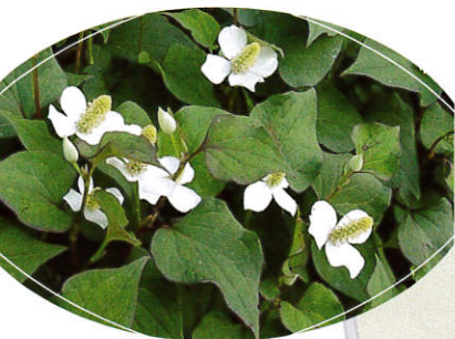
ドクダミ (ドクダミ科)

独特な臭気を持つ植物。十葉(重葉)と呼ばれる、多種多様な作用を持つ薬用植物。湿気のある場所に群生している。若芽は山菜、全草を乾燥してお茶に。