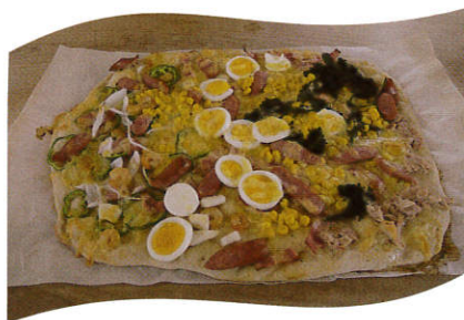
森の学校の石釜を使って焼いたピザ!

は、避難してこられた4家族15人と広島市民17人が参加し、森の学校の石釜を使ってパンやピザを焼いたり、新緑の森を散策したりして思い思いにくつろいだ1日を過ごし、交流を深めました。ひろしま自然学校では、今後も東日本応援プロジェクトとして、現地への物資支援や避難してこられた方々への応援を必要に応じて実施していく予定です。