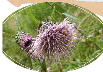
秋の湿地を彩る花-その③ ～キセルアザミ～

山野の湿地に生える多年草。茎上部に総状花序をだし、濃紫色の花が多数つく。花冠は唇形で左右相称、上唇は2深裂し、下唇は3浅裂する。