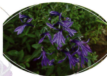
秋の湿地を彩る花-その② ～サワギキョウ～

山野の湿地に生える多年草。茎上部に総状花序をだし、濃紫色の花が多数つく。花冠は唇形で左右相称、上唇は2深裂し、下唇は3浅裂する。