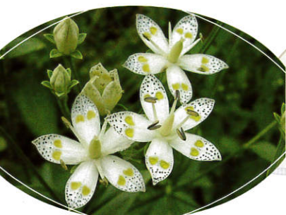
秋の湿地を彩る花-その① ～アケボノソウ～

山地の湿地に生える2年草。茎頂で枝を分け白い5弁花をつける。和名は花冠の裂片にある紫色の斑点を夜明けの空に見立てたもの。